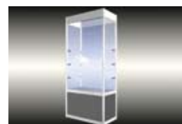
Visoka vitrina (50 cm x 100 cm x 250 cm)