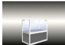
Nizka vitrina (50 cm x 100 cm x 100 cm)